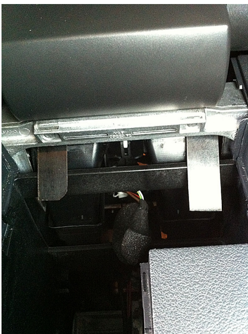
Point n°4 bis

Ici nous sommes en vue interieur (côté boîtier de rangement central retiré précédemment). Les croix rouge designent les diffuseurs de l'aérateur à extraire.