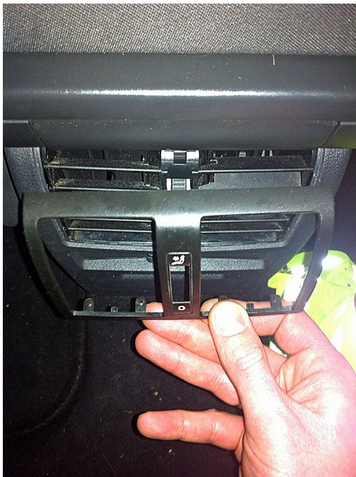
Point n°3 bis