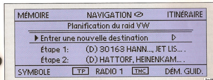
Fig. 27 Démarrage du guidage

Démarrez le guidage avec [DÉM. GUID.] et arrêtez-le avec [STOP. GUID.] .