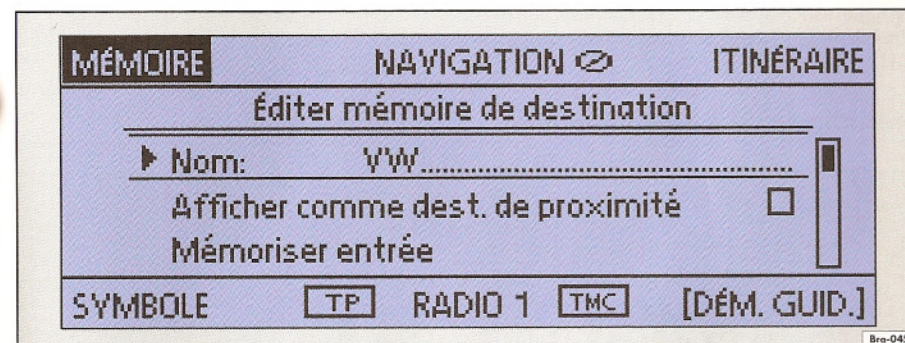
Fig. 24 Édition de la mémoire de destination : destination – VW – ouverte pour édition