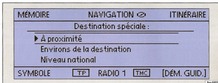
Fig. 22 Entrée d'une destination spéciale

Les destinations spéciales sont par exemple constituées par des stations-service ou des hôpitaux.