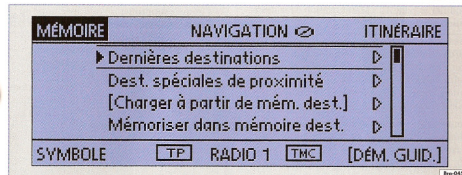
Fig. 23 Mémoire de destination

Dans la mémoire de destination, vous pouvez mémoriser les destinations et planifications de raid sélectionnées et y accéder de nouveau.